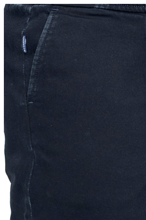
19C Blue + Overdyed Blue