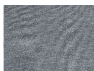
L057 Grey melange