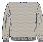
L071 Grey melange